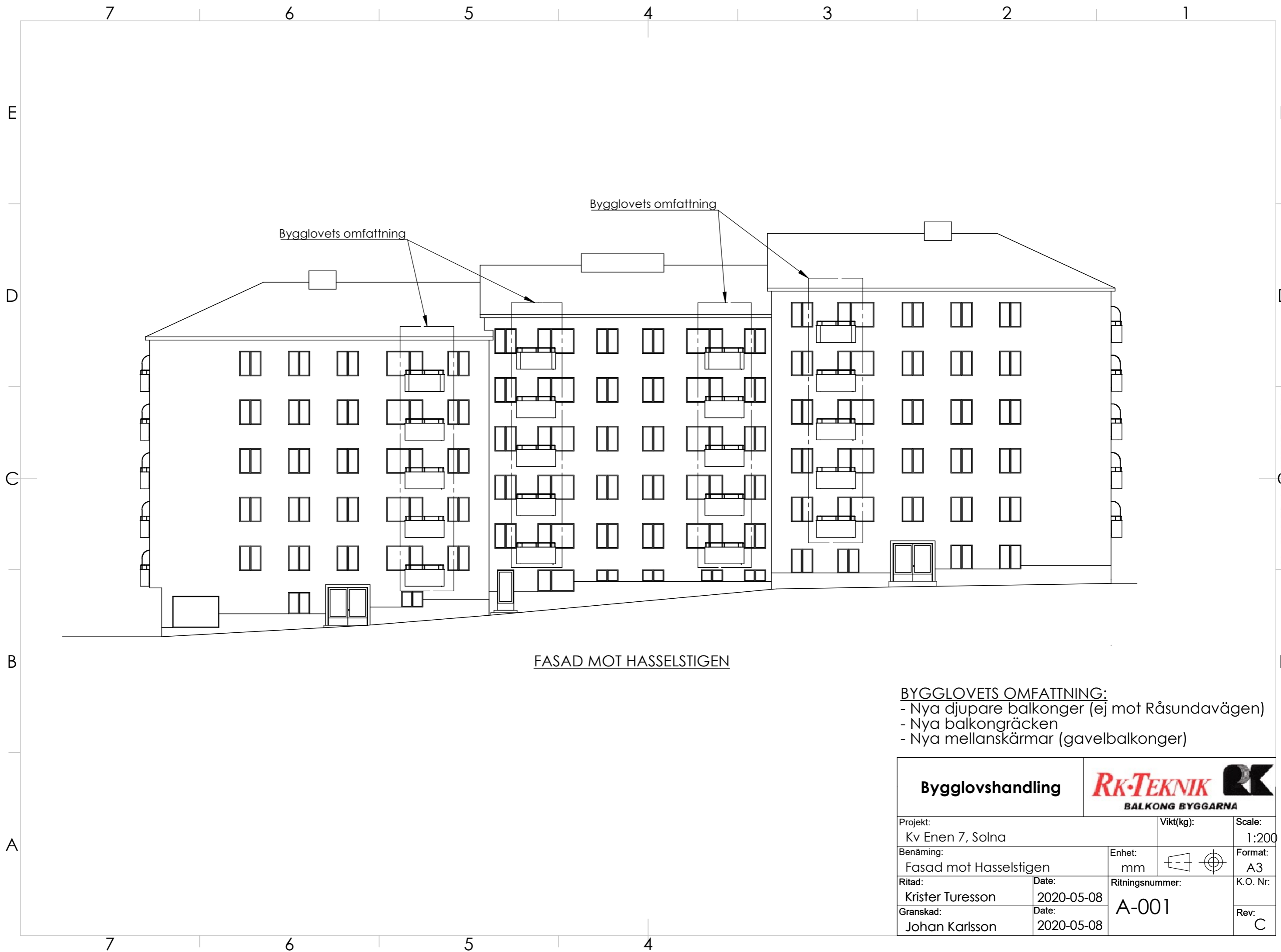
FASAD MOT HASSELSTIGEN