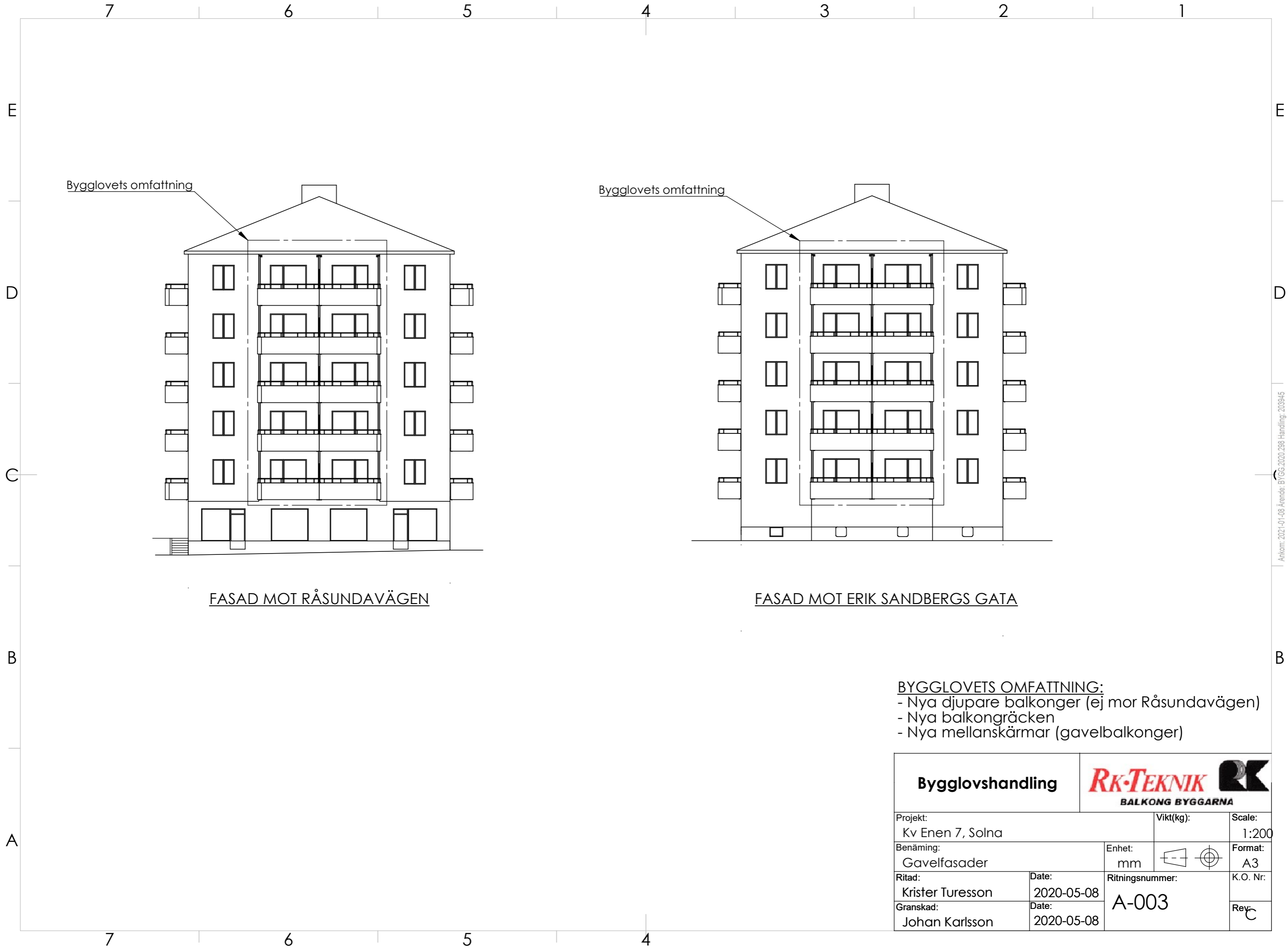
FASAD MOT RÅSUNDAVÄGEN

Detta dokument får ej kopieras utan vår skriftliga tillåtelse, dessutom får dess innehåll ej delges 3:e part eller användas för av oss ej godkänt syfte. Överträdelse beivras. Dokument tillhör beslut Bnd 2021C:129 Bygglövsarkitekt Cristina Moreira, 2021-02-05, BYGG.2020.298